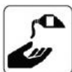
DEZINFECTARE PE MĂINI