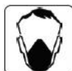
UTILIZAREA MĂȘTII DE PROTECȚIE