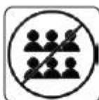
EVITAREA SPAȚIILOR AGLOMERATE