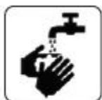
SPĂLARE FRECVENTĂ PE MĂINI CU APĂ ȘI SĂPUN